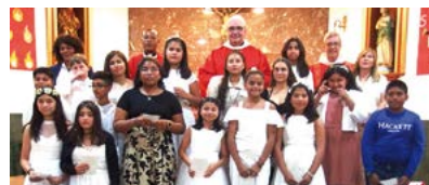
Confirmacions a Rubí

Confirmacions. El dissabte 27 de maig, Mons. Salvador Cristau confirmà 5 adolescents i joves de la Parròquia de Sant Cristòfol de Lliçà de Vall i Mn. Fidel Catalán, vicari general, confirmà 13 adolescents i joves a la Parròquia de Sant Pau de Rubí.