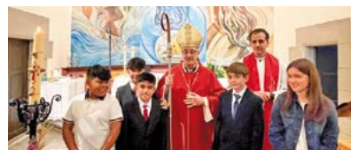
Confirmacions a Lliçà de Vall

Tercera trobada d'adolescents. El divendres 26 de maig, a la tarda, tingué lloc la tercera trobada d'adolescents organitzada per la Delegació de Joventut. 130 joves es reuniren al Col·legi diocesà de la Mare de Déu de la Salut.